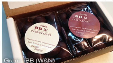
Grani - BB (W&N)