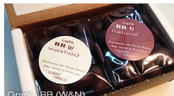
Grani - BB (W&N)