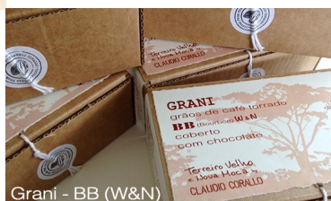
Grani - BB (W&N)