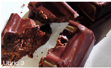
Chocolate 70% with raisins in rose muscat distillate